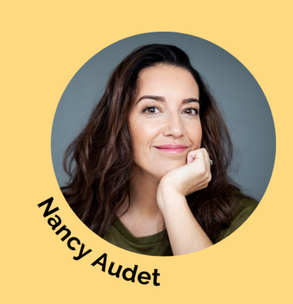
Ambassadrice du programme